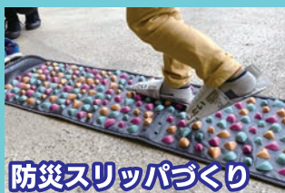
防災スリッパづくり