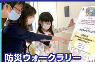
防災ウォークラリー