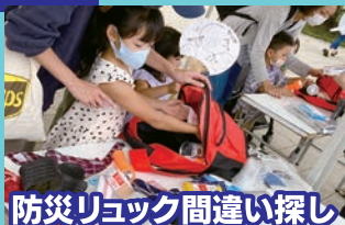
防災リュック間違い探し